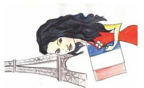
Грануш Степанян, ФилФак