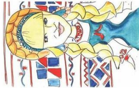
Евгения Фалыхова, ГеоФак