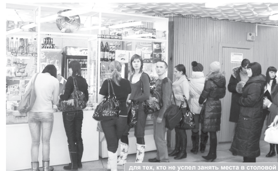
для тех, кто не успел занять места в столовой