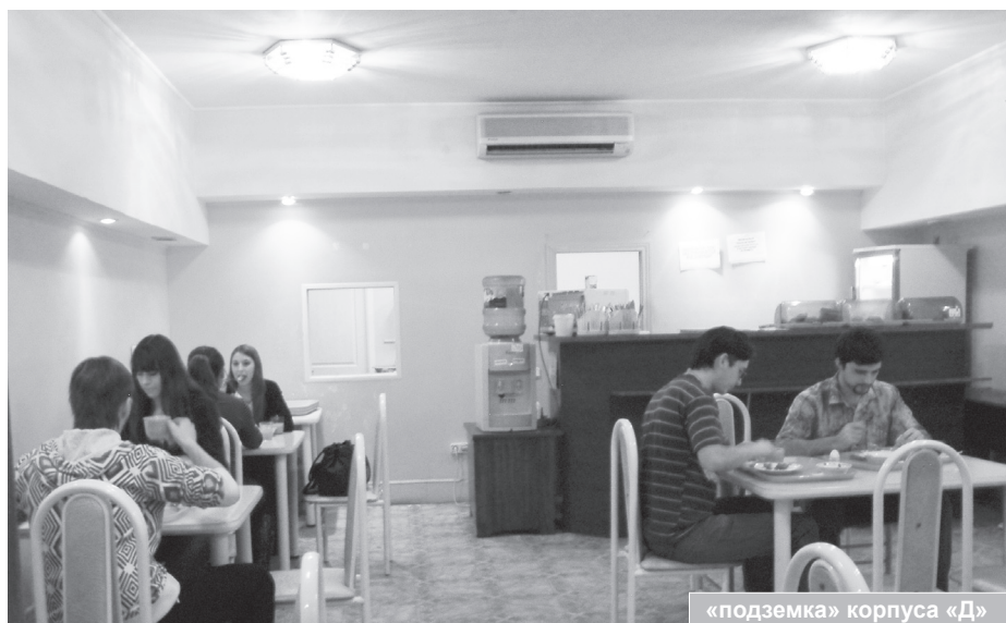
«подземка» корпуса «Д»

студентов явно не достаточно. Культовое блюдо – салат (причем не важно, какой), в котором очень много лука. Съев его, можно смело идти на зачет (как герой «Ералаша»), в надежде, что преподаватель не догадается взять противогаз. Для снегурочек и дедов морозов в рационе имеется мороженое. Лишь бы не растаяло, пока до кассы дойдешь. А еще существует легенда, что энергия, на которой готовится еда, вырабатывается занимающимися в соседнем помещении спортсменами. Но мы проверили – это не так... Можете есть спокойно. Если успеете.