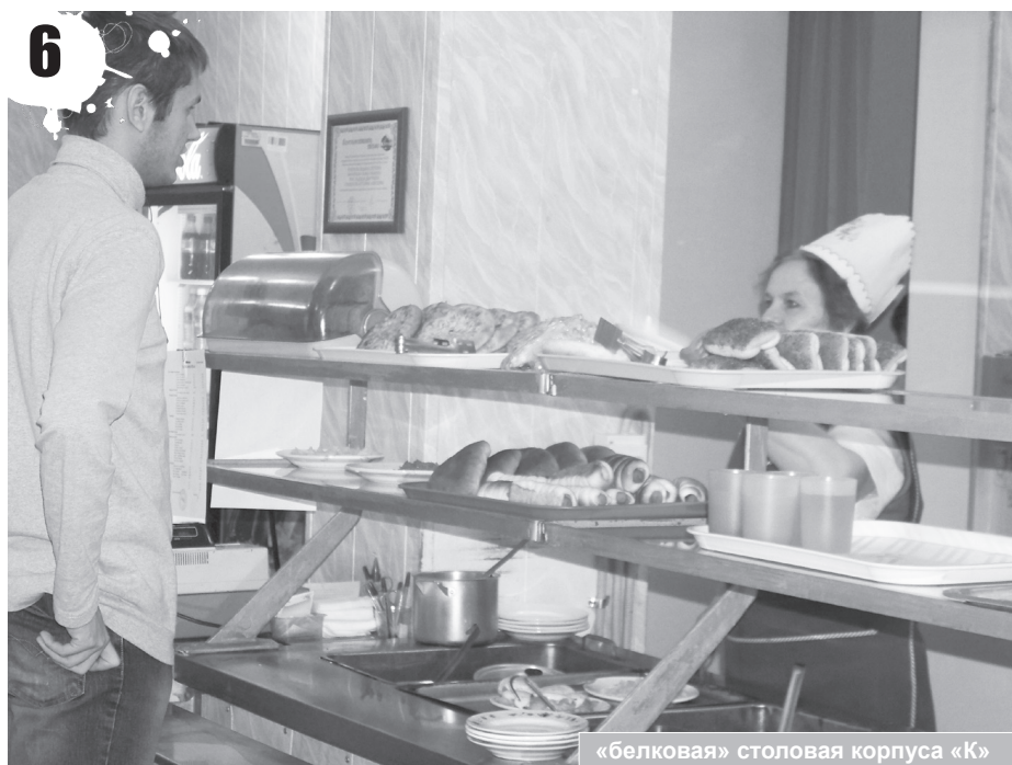
«белковая» столовая корпуса «К»

Сегодня мы пройдемся по столовым нашего университета и посмотрим где студенту не только учиться, но и покушать хорошо.