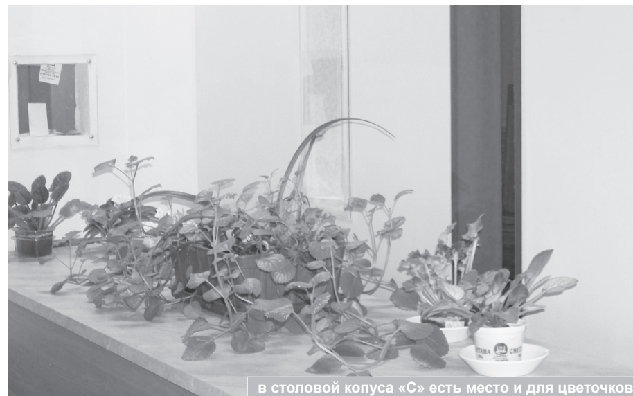
в столовой корпуса «С» есть место и для цветочков

текст: Ирина Демидова