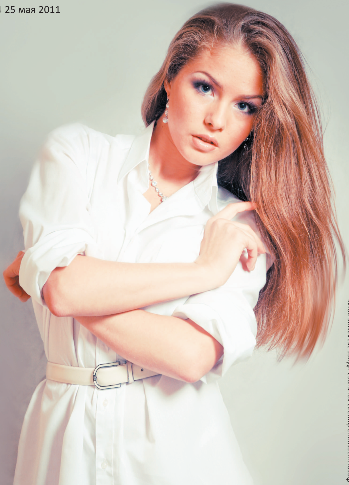
Фото: участница финала конкурса «Мисс академия 2011»